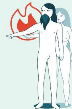
IL PADRE MOVIMENTO 3