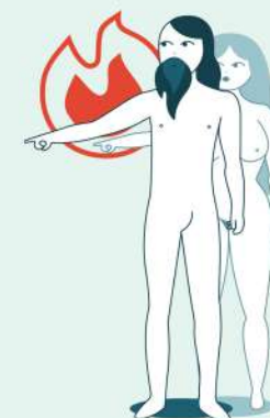
IL PADRE MOVIMENTO 3